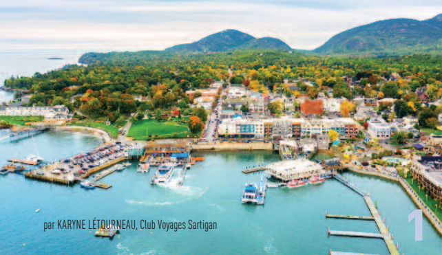
par KARYNE LÉTOURNEAU, Club Voyages Sartigan