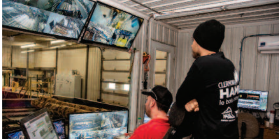
LA QUALITÉ ACCRUE DU SIGNAL PERMET MAINTENANT D'ÉTABLIR UNE COMMUNICATION CELLULAIRE FIABLE À LA GRANDEUR DU SITE