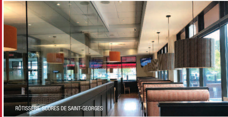
RÔTISSERIE SCORES DE SAINT-GEORGES