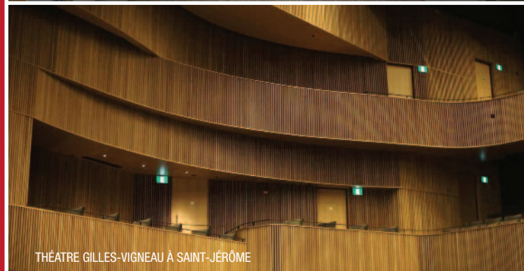
THÉÂTRE GILLES-VIGNEAU À SAINT-JÉRÔME