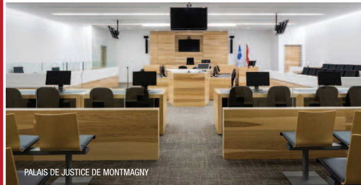
PALAIS DE JUSTICE DE MONTMAGNY