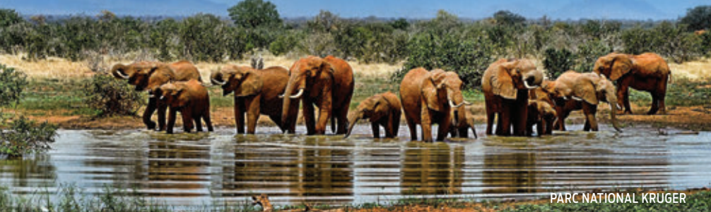
PARC NATIONAL KRUGER