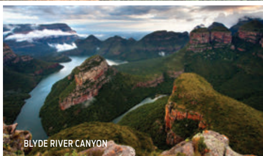
BLYDE RIVER CANYON