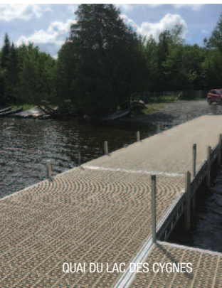
QUAI DU LAC DES CYGNES