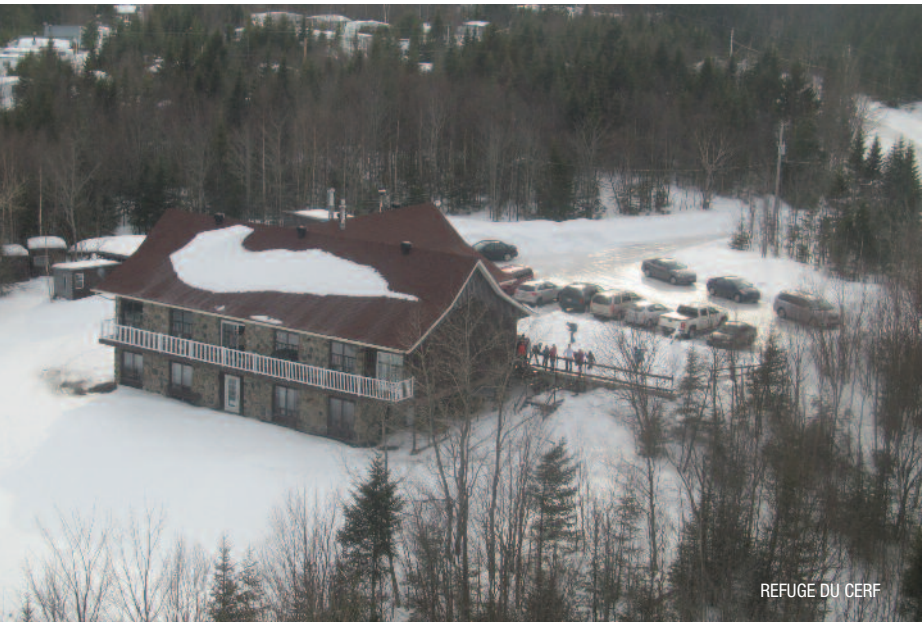
REFUGE DU CERF