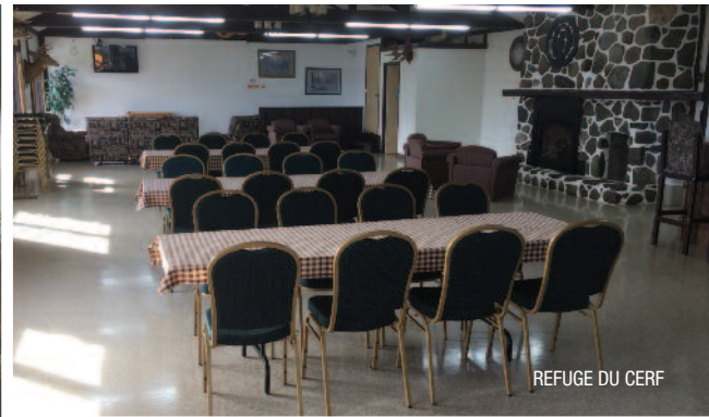
REFUGE DU CERF