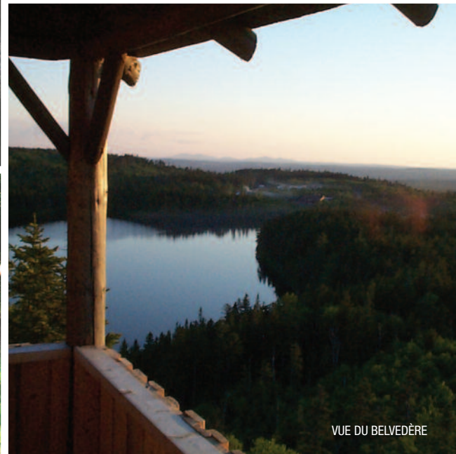
VUE DU BELVÈDÈRE