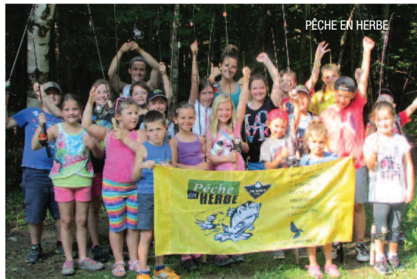
PÊCHE EN HERBE